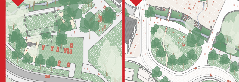
29 / Nová hřiště a parkoviště 30 / Nová klidná a zelená návěs