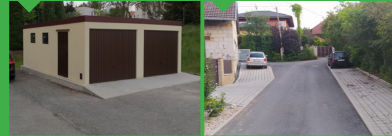
9 / Garáž pro obecní údržbu 10 / Nový povrch vozovky