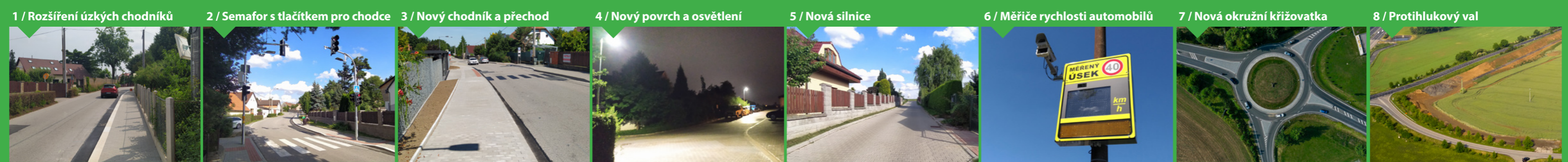
1 / Rozšíření úzkých chodníků 2 / Semafor s tlačítkem pro chodce 3 / Nový chodník a přechod 4 / Nový povrch a osvětlení 5 / Nová silnice 6 / Měříče rychlosti automobilů 7 / Nová okružní křižovatka 8 / Protihlukový val