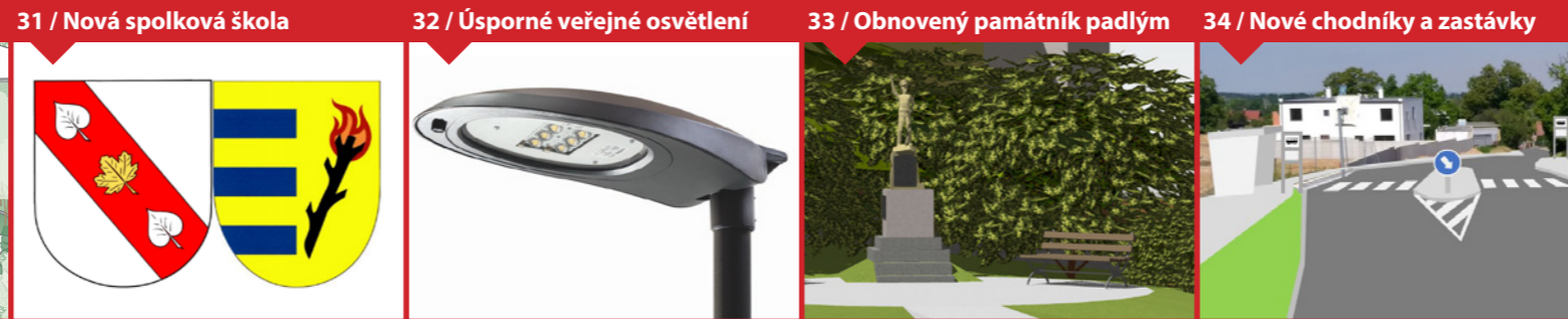
31 / Nová spolková škola 32 / Úsporné veřejné osvětlení 33 / Obnovený památník padlým 34 / Nové chodníky a zastávky 35 / Dokončení valu, nová cesta 36 / Oprava břehů, nový mostek