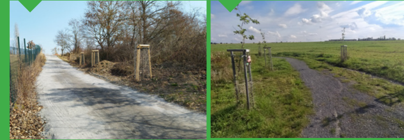
13 / Nová cesta, alej 14 / Nová cesta, alej