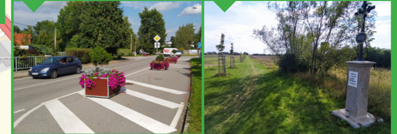
15 / Obnovená cesta, nové stromy 16 / Nová alej a povrch silnice