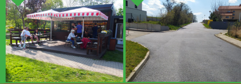
21 / Kiosek pekárny 22 / Nový povrch silnice