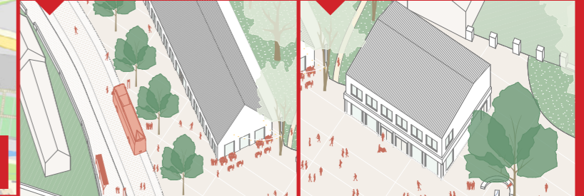
29 / Nová hřiště a parkoviště 30 / Nová klidná a zelená návěs