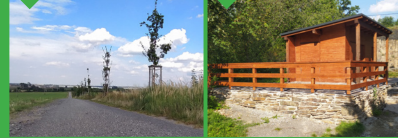
17 / Nová alej 18 / Větší altán, nová terasa